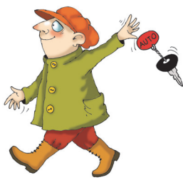
Jalutuskäik või matk